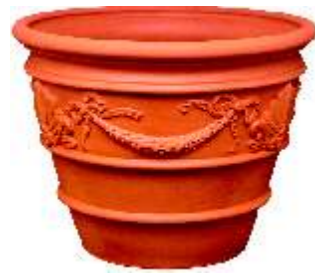
MACETA PIE NATURAL