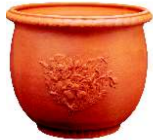
MACETA ROSAS CUERDAS