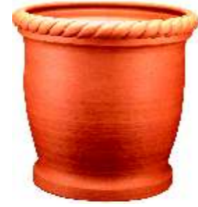
MACETA CUERDA LISA