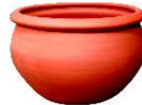
MACETA MIMBRE LISA